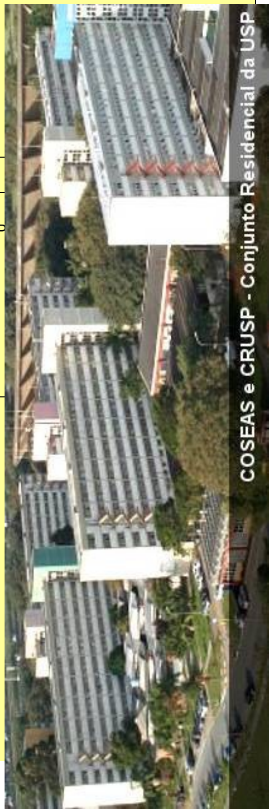
COSEAS e CRUSP - Conjunto Residencial da USP