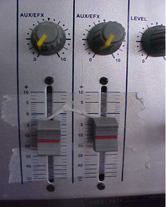
VOLUME MASTER Volume Geral da Mesa de Som