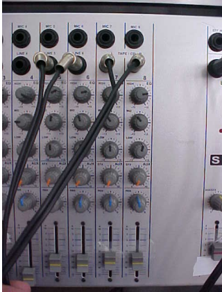
CANAL 5 e 6 (Tape-Deck) CANAL 7 e 8 (CD Player)