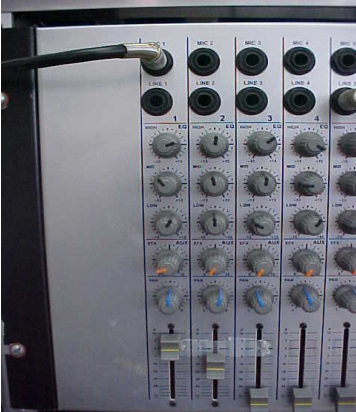
CANAL 1 e 2 1 Regulagem – MIC/FIO 2 Regulagem - MIC/ Sem FIO