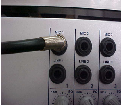
CONEXÃO MESA DE SOM – MIC