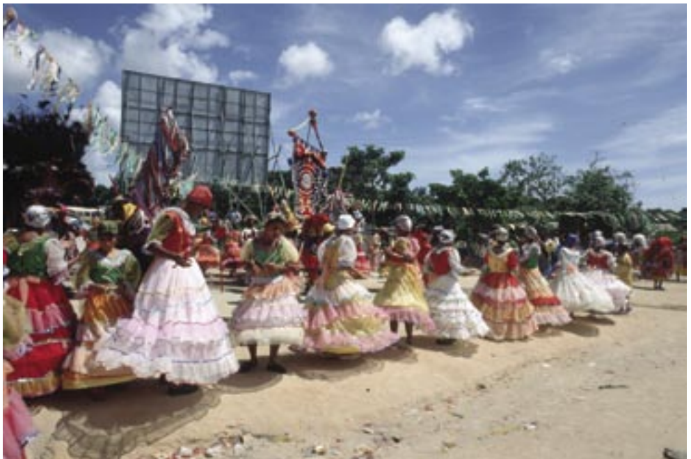
Maracatu “Piaba de Ouro” em apresentação de rua em Cidade Tabajara, PE, 1990