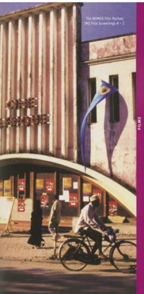
Foto do catálogo da Womex, Sevilha, Espanha, 2007

Claro que surgiram vários nomes e movimentos interessantes depois disso, o mangue, os baianos, mas nada se compara ao que foi a cena da MPB daquele período. É importante notar que àquela altura o Brasil desejava para si uma música muito