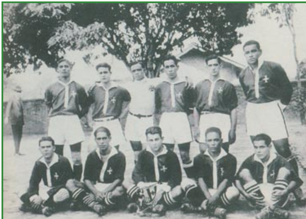
Time do Vasco de 1923

Brasil agrícola e mestiço. E, também, uma Europa dividida e integrada com um Brasil desigual e combinado.